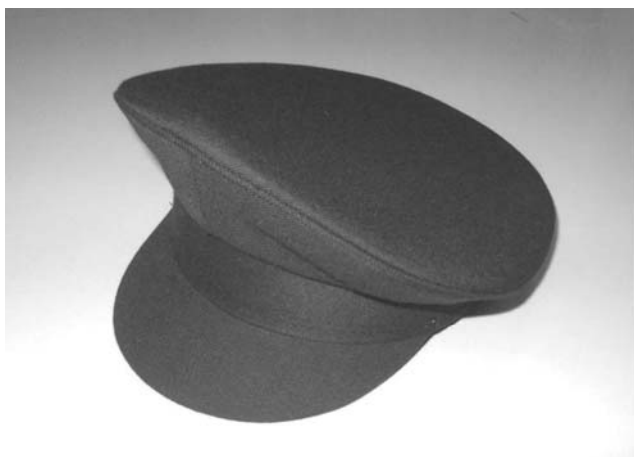
Hasičská brigádýrka pracovní cena 60,- Kč (bez DPH)

Termín předběžných objednávek z přístavů je do 22. 2. 2007 Majdě na mabab@seznam.cz