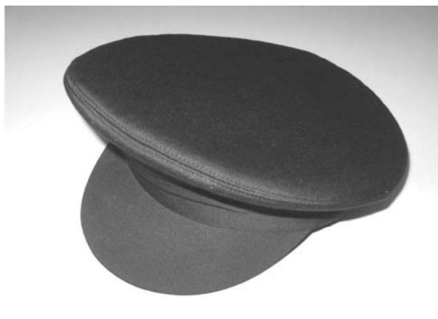
Hasičská brigádýrka společenská cena 430,- Kč (bez DPH)