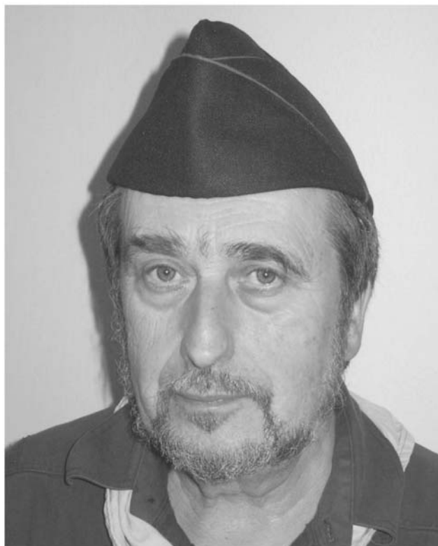
Hasičská lodička cena 40,- Kč (bez DPH)