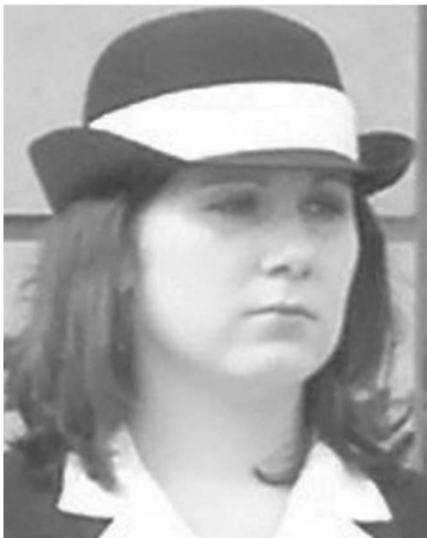
Hasičský klobouček slavnostní cena cca 440,- Kč (bez DPH)